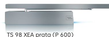
TS 98 XEA prata (P 600)

TS 98 XEA: um excelente design que abre portas. Não só é adequada como elemento estético, como também pode ser facilmente combinada com uma vasta gama de produtos dormakaba com o design XEA. Graças às numerosas variantes de cores e aos diversos acabamentos de superfície, terá à sua disposição toda uma gama de opções de personalização, e pode ser tão flexível quanto desejar do ponto de vista estético.